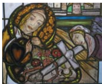
Verhaal van de stadshelige