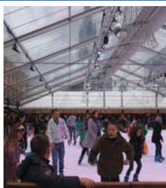
Patrones van de schaatsers