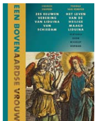
Nieuw boek gepresenteerd

MAGAZINE VAN DE ROOMS-KATHOLIEKE PAROCHIE DE GOEDE HERDER MAASLUIS VLAARDINGEN SCHIEDAM • VOORJAAR 2015